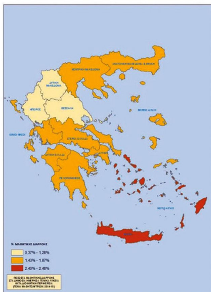
ΧΑΡΤΗΣ 3 : ΜΑΘΗΤΙΚΗ ΔΙΑΦΡΟΝ ΣΤΑ ΔΗΜΟΣΙΑ ΗΜΕΡΗΣΙΑ ΓΕΝΙΚΑ ΛΥΚΕΙΑ ΚΑΤΑ ΔΙΟΙΚΗΤΙΚΗ ΠΕΡΙΦΕΡΕΙΑ (ΓΕΝΙΑ ΜΑΘΗΤΩΝ/ΤΡΙΩΝ: 2014-15)

υπόβαθρο), ή των παιδιών και εφήβων των οποίων η πορεία δεν παρακολουθείται μέσω του πληροφοριακού συστήματος.